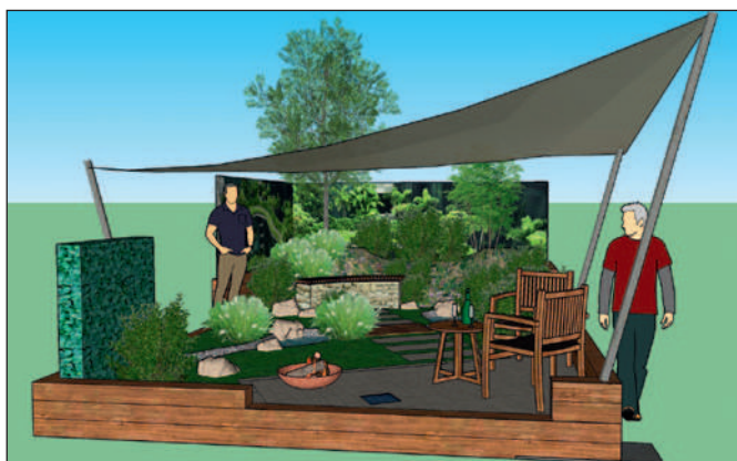
▲ A versenykert látványterve

Ez a kert nemcsak az embereknek, hanem a növény- és állatvilágnak is készült. Volt benne rovarhotel, amit a versenyzőknek különböző anyagokkal kellett megtölteniük. Volt madárodú és a megporzó rovarfajok számára nektárt és pollent termelő növényzet is. Egy kicsi fűszer- és zöldségeskert is helyet kapott benne, ami azt sugallja, hogy mindenki meg tudja termesztetni a konyhát